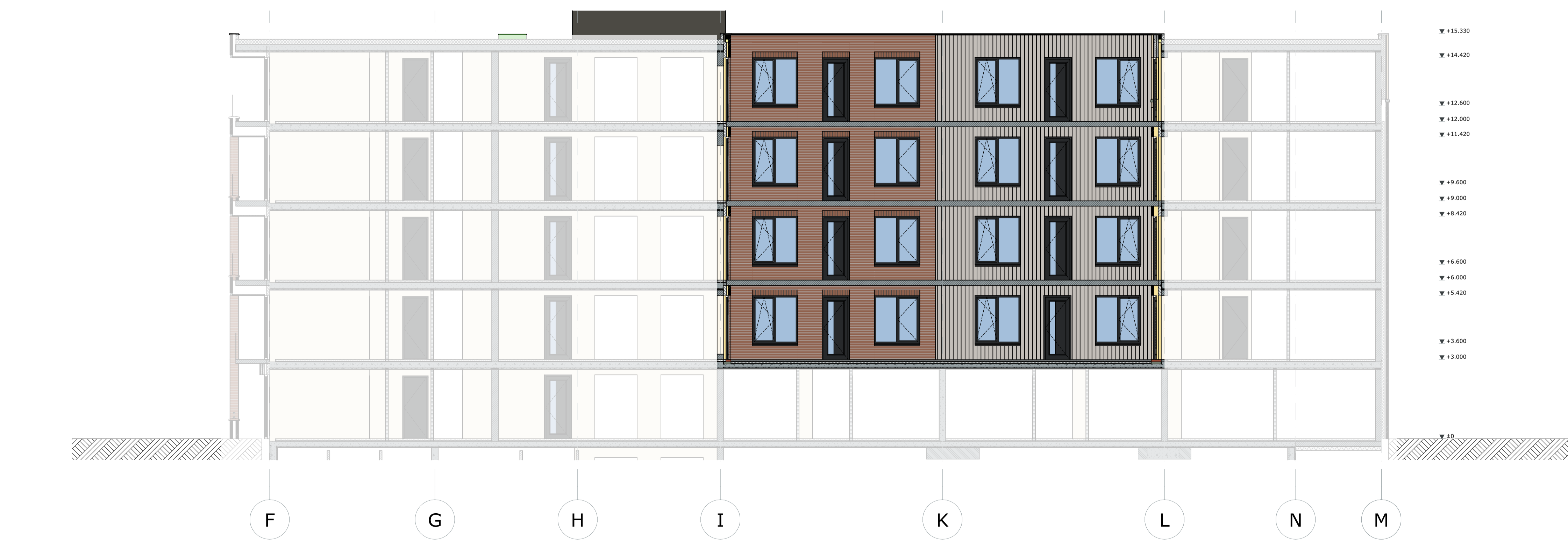
Achtergevel Westergracht (galerij)